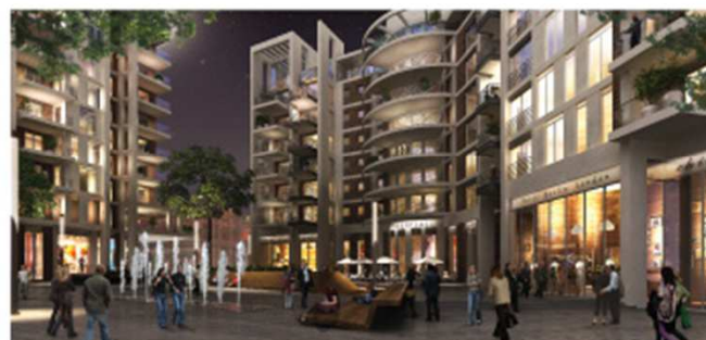
בצלאל, תל אביב מסחר וחניון