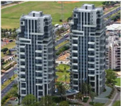
חוות גורדון תל אביב 169 יח"ד