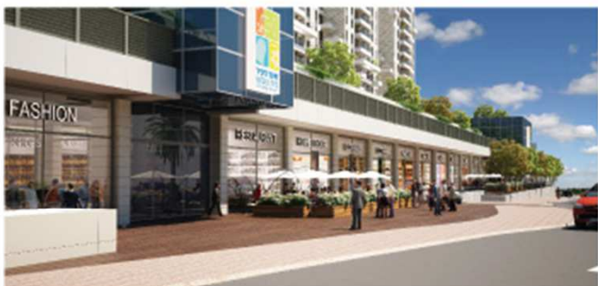
נופיה, בית שמש מסחר