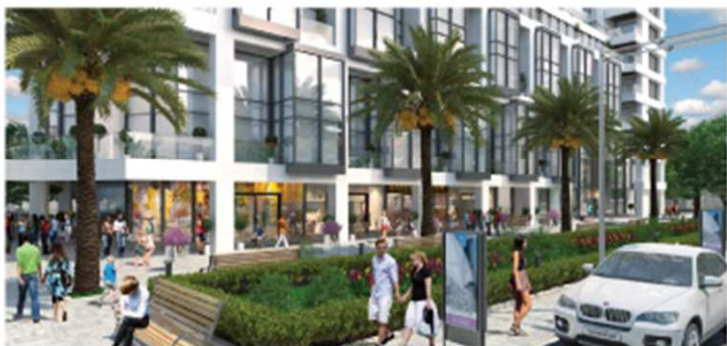
נווה צדק 1, תל אביב מסחר וחניון